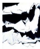
17. JACQUES HURTUBISE, IL Y EUT UN BLANC , 1963, ACRYLIQUE SUR TOILE, 179 X 126,8 CM, MNBAQ, ACHAT (1969.208) © SUCCESSION JACQUES HURTUBISE / SODRAC (2016)