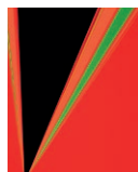
6. RITA LETENDRE, IN SPACE , 1969, SÉRIGRAPHIE, 66 X 50,8 CM, MNBAQ, DON ANONYME (2004.372) © RITA LETENDRE