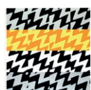
12. JACQUES HURTUBISE, JANETTE , 1969, SÉRIGRAPHIE, 72,4 X 57,2 CM, MNBAQ, ACHAT (1970.50) © SUCCESSION JACQUES HURTUBISE / SODRAC (2016)