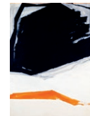
28. JACQUES HURTUBISE, AGONIE , 1964, ACRYLIQUE SUR TOILE, 177,4 X 125,5 CM, MNBAQ, DON DE PATRICE ET ANDRÉE DROUIN (1988.124) © SUCCESSION JACQUES HURTUBISE / SODRAC (2016)