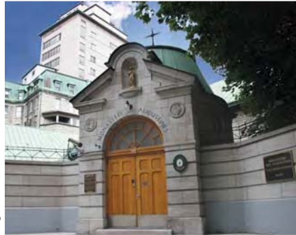
Le monastère des Augustines