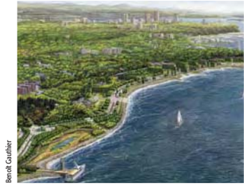
La promenade Samuel-De Champlain