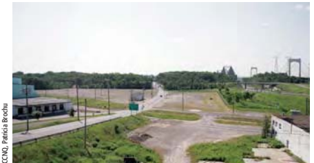
Les terrains vacants près des ponts de Québec

en voie d'acquisition par le ministère des Transports du Québec. Plans et devis et réalisation en 2006-2007; coût pour la Commission : 250 000$.