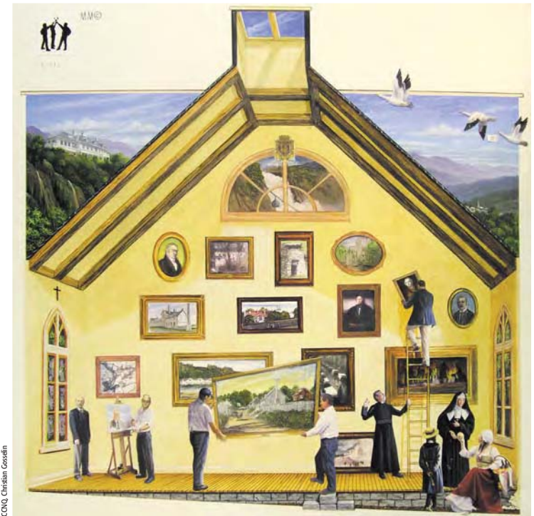
La Fresque Desjardins de Beauport (maquette)