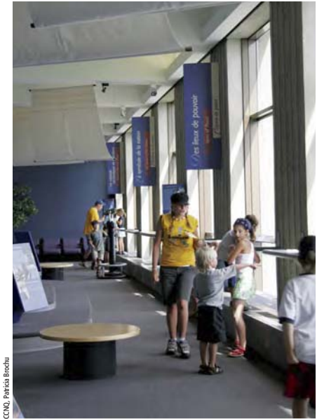
L'Observatoire de la Capitale

et de développer substantiellement la part des visiteurs individuels. Elle accroîtra enfin le taux d'autofinancement du programme et réalisera, dans le cadre des événements de 2008, un circuit original voué à devenir un exercice incontournable pour les nombreux visiteurs.