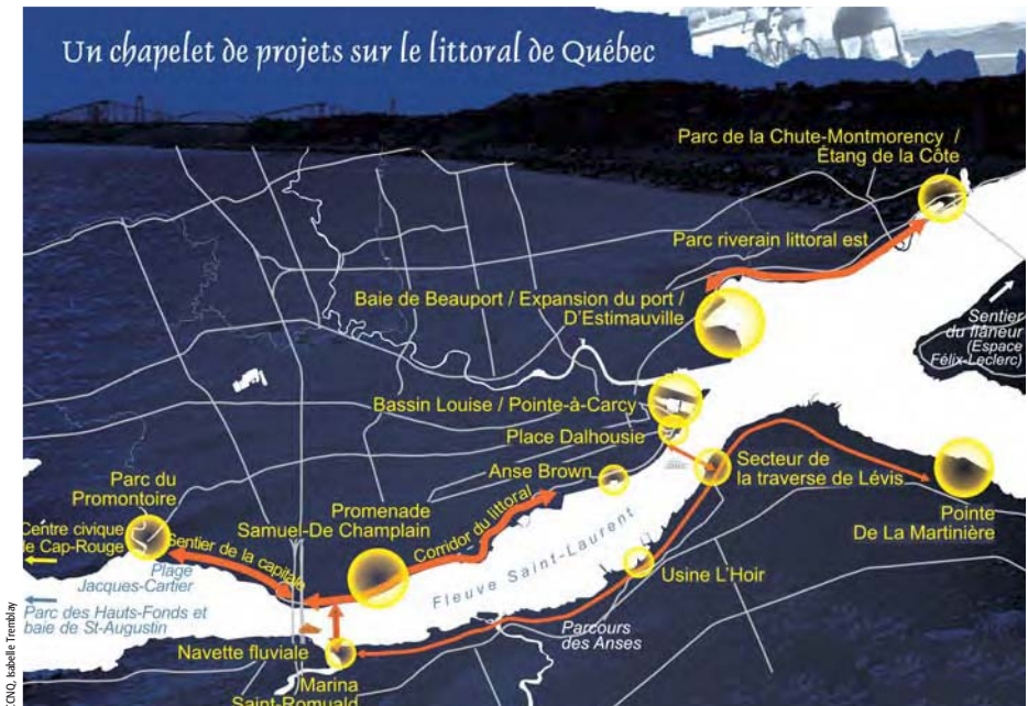
Les sentiers piétons

De plus, la Commission sera largement engagée dans le processus d'évaluation environnementale, incluant les audiences publiques qui auront lieu normalement en novembre 2005.