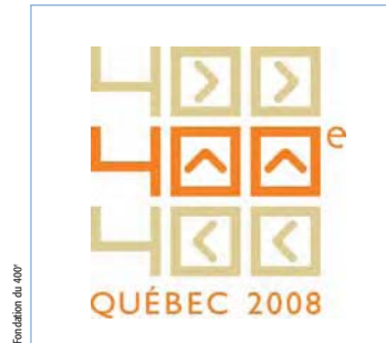
Le logo du 400 e