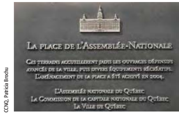
Les plaques commémoratives – nouveau design