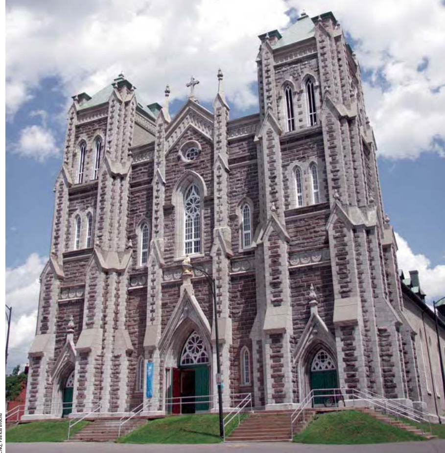
L'église Notre-Dame de la Nativité