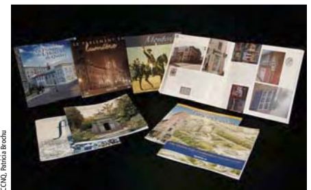
Les différentes collections de la Commission