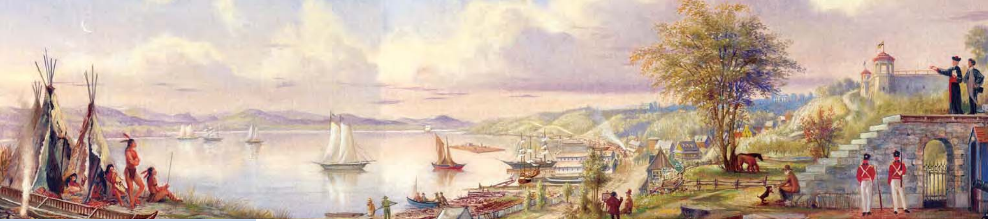
La Fresque Desjardins de Lévis (détail de la maquette)