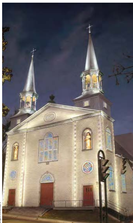
L'église de Saint-Charles-Borromée – Infographie