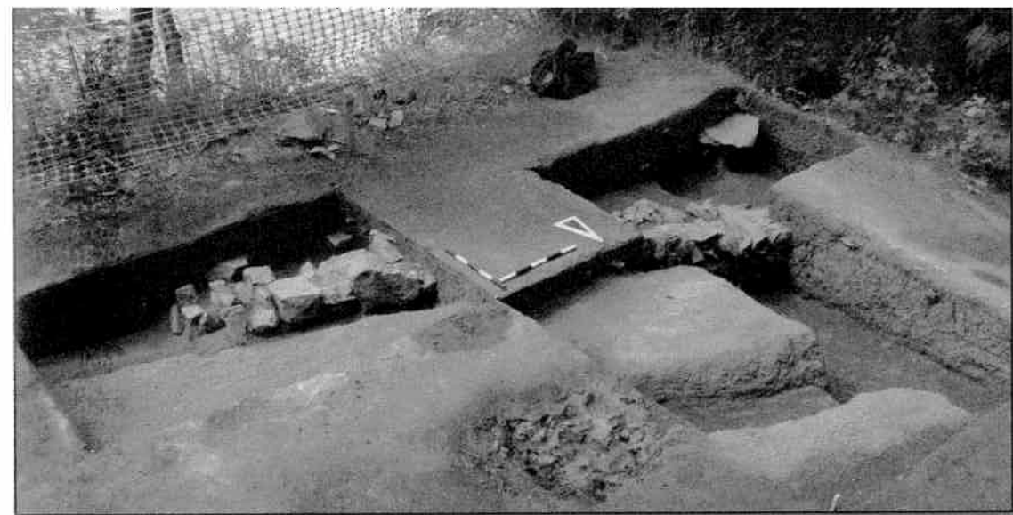
■ Vestiges des fondations de l'édifice. (Commission de la capitale nationale du Québec).

En parlant des « gens du commun », nous n'avons encore aucun indice vérifiable sur l'emplacement occupé par ceux-ci. Or, Roberval nous