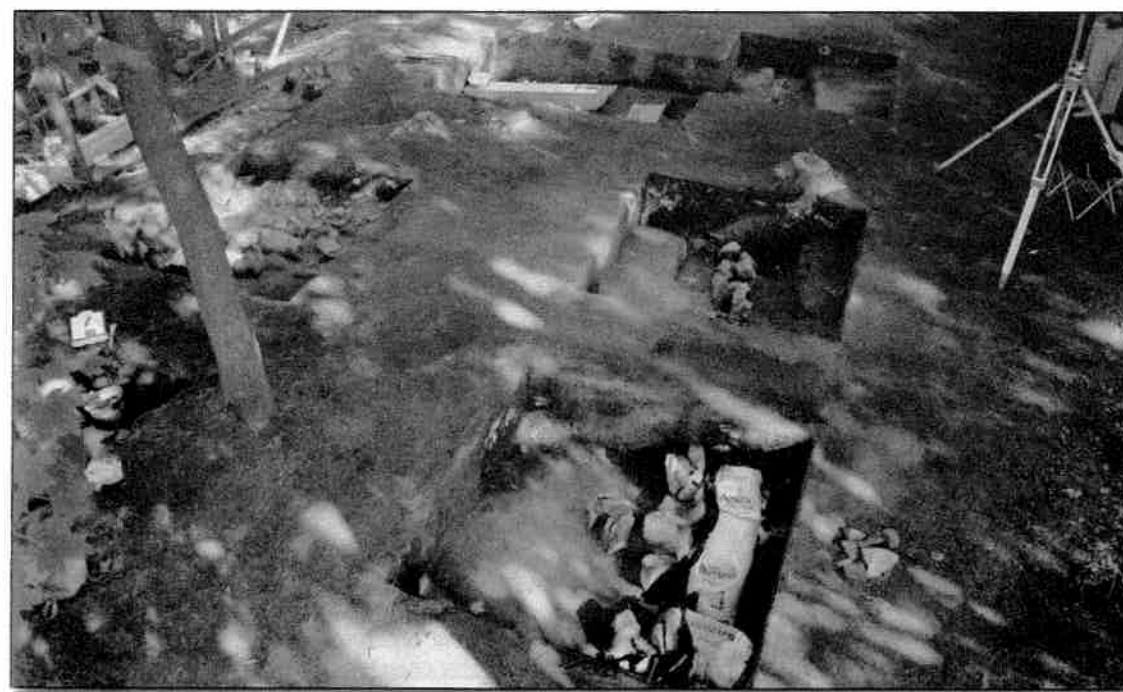
Trois opérations dans lesquelles apparaît le mur de dix mètres. (Commission de la capitale nationale du Québec).

Aussi, les creusets nous indiquent qu'on y mena probablement des expériences minéralogiques (étroitement surveillées...), tandis que d'autres artefacts sont des témoins de l'activité de tous les jours tels que la préparation des aliments (fragment de marmite en fonte et autres), le service de table et la consommation des aliments (plats, plateaux, bols, coupes, etc.), l'apparat (bijoux, etc.) et la couture (dé à coudre). On note aussi la présence d'objets possiblement liés à la finance (des clefs, peut-être celles d'un coffret), aux jeux (pièce de jeu, possiblement de dames), et peut-être même les signes d'une activité reli-