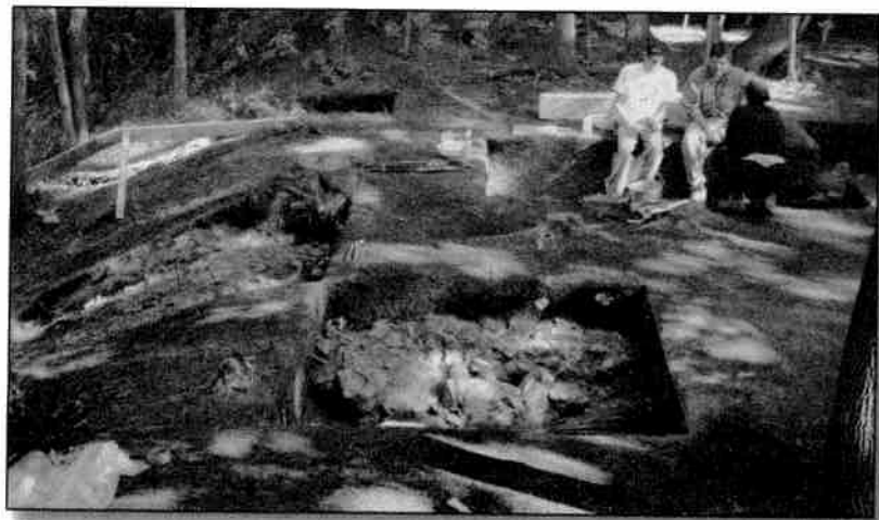
■ Massif de pierres qui aurait pu accueillir une plate-forme à canon. (Commission de la capitale nationale du Québec).

Selon notre interprétation, ces cavités seraient l'empreinte de pieux verticaux ou potelets ayant servi à la constitution du mur; ils seraient disparus par enlèvement ou par décomposition en place. Selon l'analyse socio-topographique du lieu, ce mur serait la limite d'un édifice (édifice 3) résidentiel ayant un axe longitudinal parallèle à la rivière du Cap Rouge.