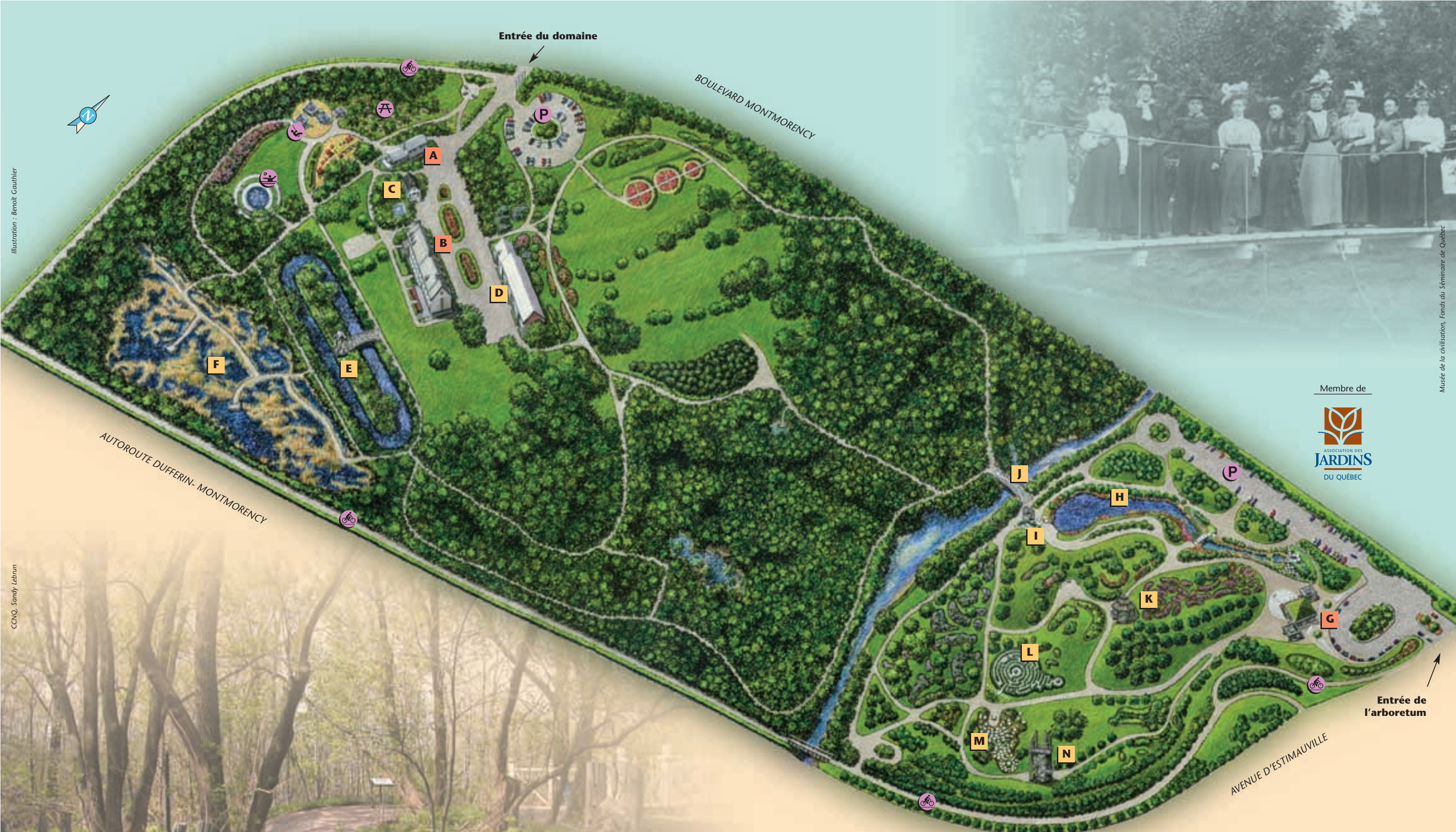
Illustration : Benoit Gauthier