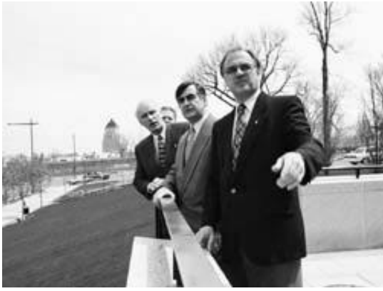
Pierre Boucher, le premier ministre Lucien Bouchard et le ministre responsable de la région de la capitale, Jean Rochon, président l'ouverture de la promenade des Premiers-Ministres, sur le côté sud du boulevard René-Lévesque Est, superbement réaménagé.