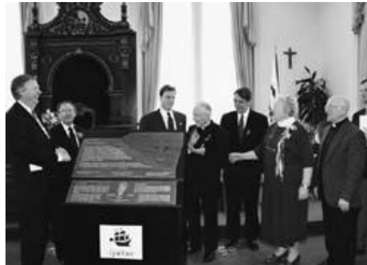
À l'hôtel de ville de Québec, la communauté irlandaise entoure le primat de l'église d'Irlande, le cardinal Daly, pour assister au dévoilement de l'hommage aux Irlandais rendu par la Ville de Québec et la Commission à l'occasion du 150 e anniversaire de la Grande Famine de 1847.